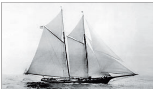
La goleta America > En 1851, ganó la Copa de las 100 guineas.

La prepotencia de aquellos nuevos ricos de Nueva York pronto les traicionó. Cuando estaban a punto de arribar a su destino, se cruzaron con uno de los barcos más rápidos del momento e hicieron alarde de su velocidad. Al llegar a Cowes, ya había corrido la voz de sus prestaciones y nadie quiso jugarle los cuartos contra ellos.