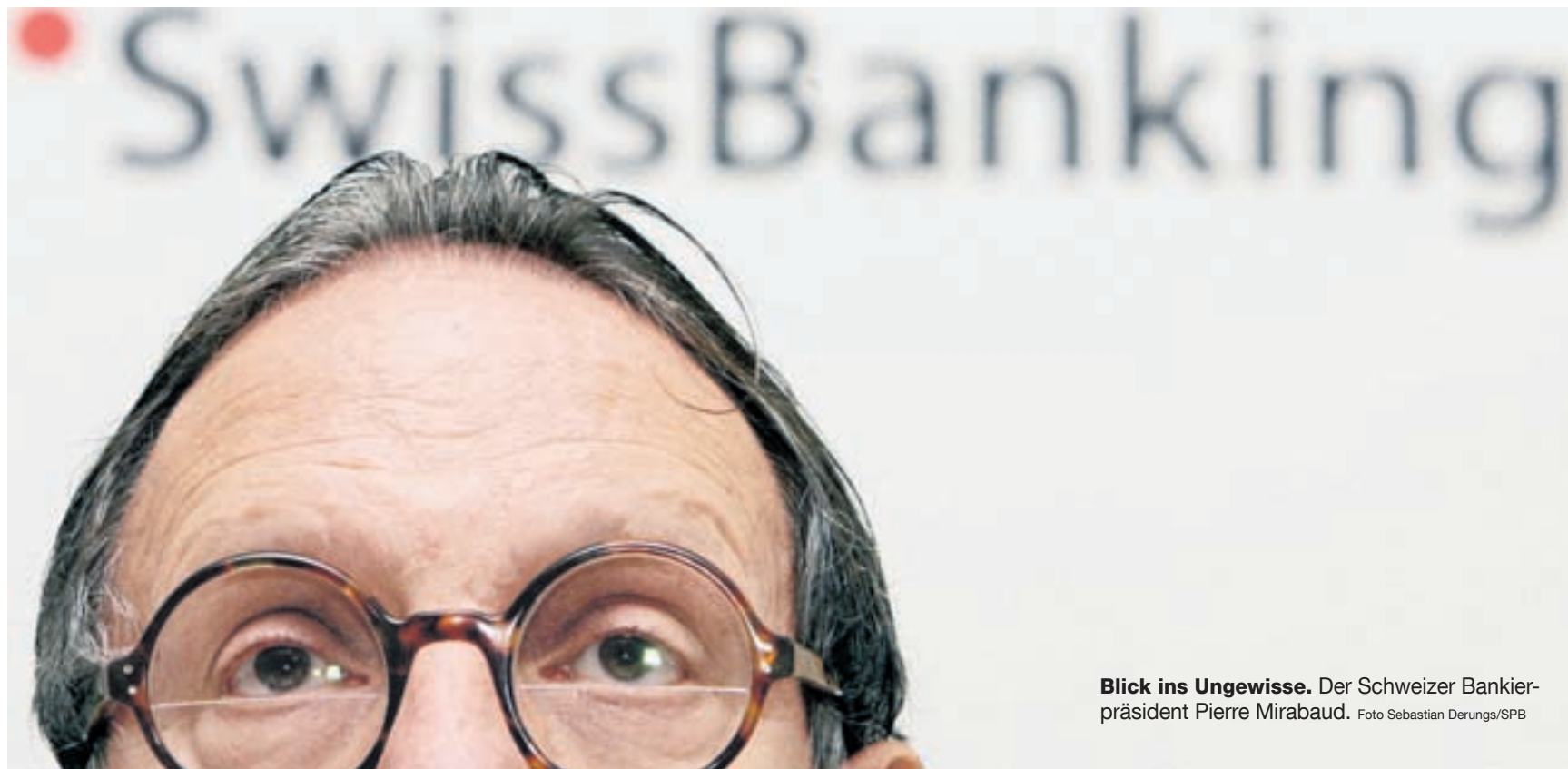
Blick ins Ungewisse. Der Schweizer Bankierpräsident Pierre Mirabaud.

Finanzspritzen der Notenbanken helfen auch den UBS-Aktien wieder auf die Beine